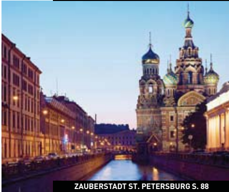
ZAUBERSTADT ST. PETERSBURG S. 88