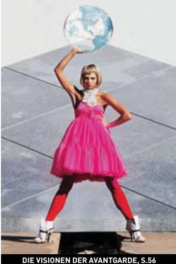
DIE VISIONEN DER AVANTGARDE, S.56