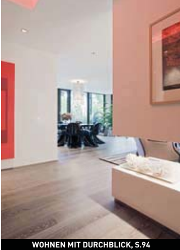
WOHNEN MIT DURCHBLICK, S.94