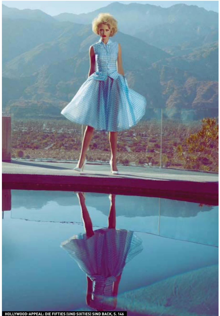
HOLLYWOOD-APPEAL: DIE FIFTIES (UND SIXTIES) SIND BACK, S. 146